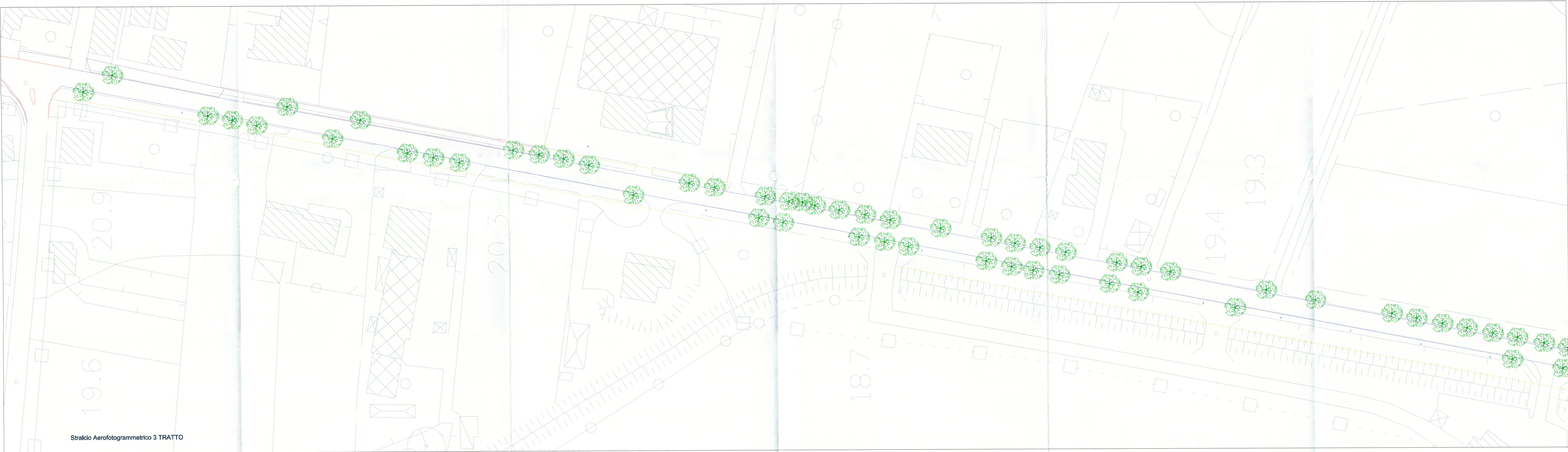
Stralcio Aerofotogrammetrico 3 TRATTO