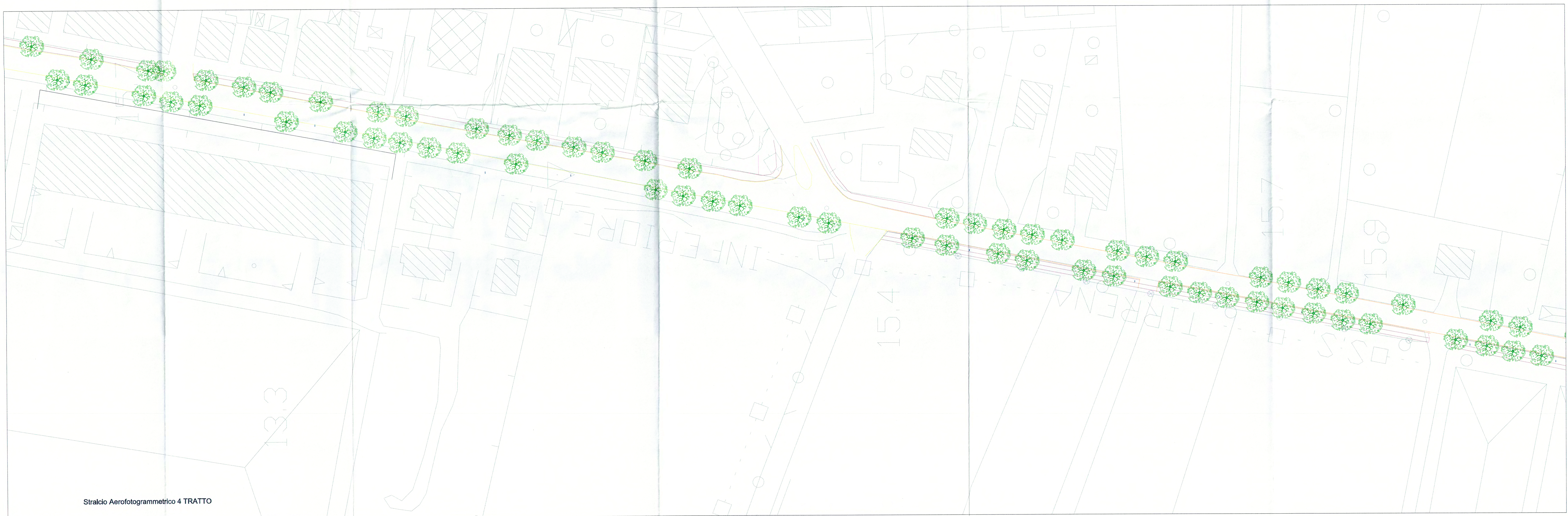
Stralcio Aerofotogrammetrico 4 TRATTO