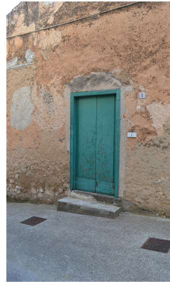
[1] distacco dell'intonaco utilizzo di intonaci cementizi patina biologica