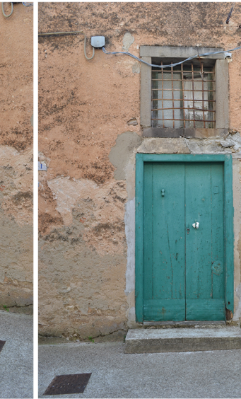
[2] distacco dell'intonaco impianti a vista patina biologica