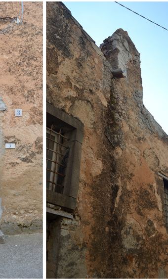
[3] distacco dell'intonaco macchie da dilavamento patina biologica