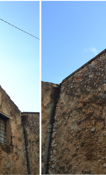
[4] distacco dell'intonaco impianti a vista patina biologica