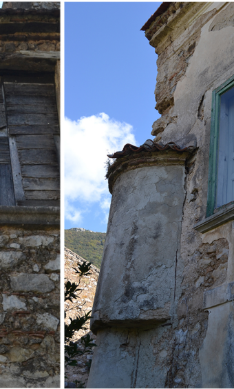
[7] distacco dell'intonaco mancanza di cornici patina biologica