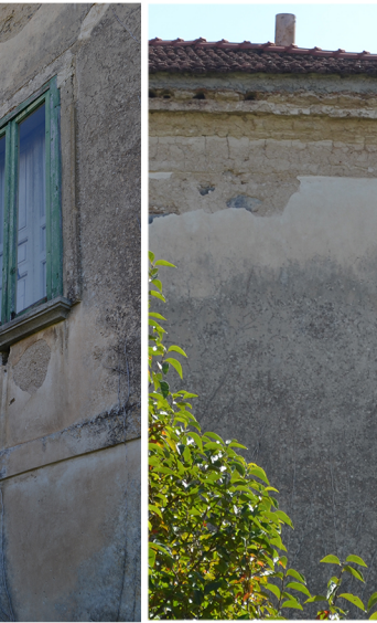
[8] distacco dell'intonaco mancanza di cornici patina biologica