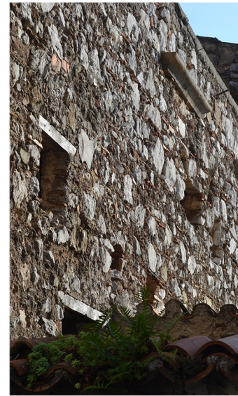
[5] distacco dell'intonaco disgregazione delle malte