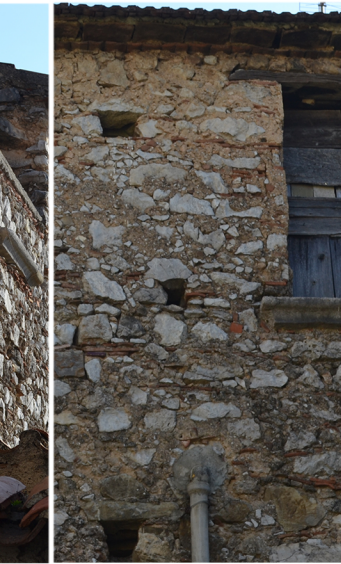
[6] distacco dell'intonaco disgregazione delle malte impianti a vista