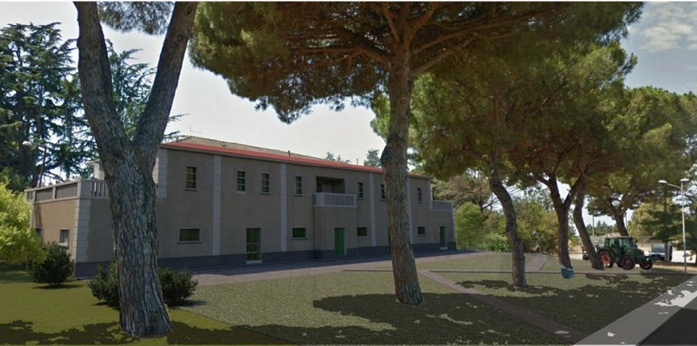
Fotoinserimento Prospetto Principale Fabbricato A Ambito Gromola