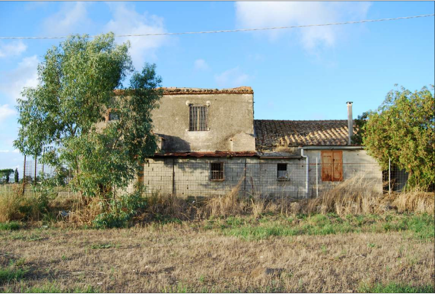
FOTO 5 prospetto sud