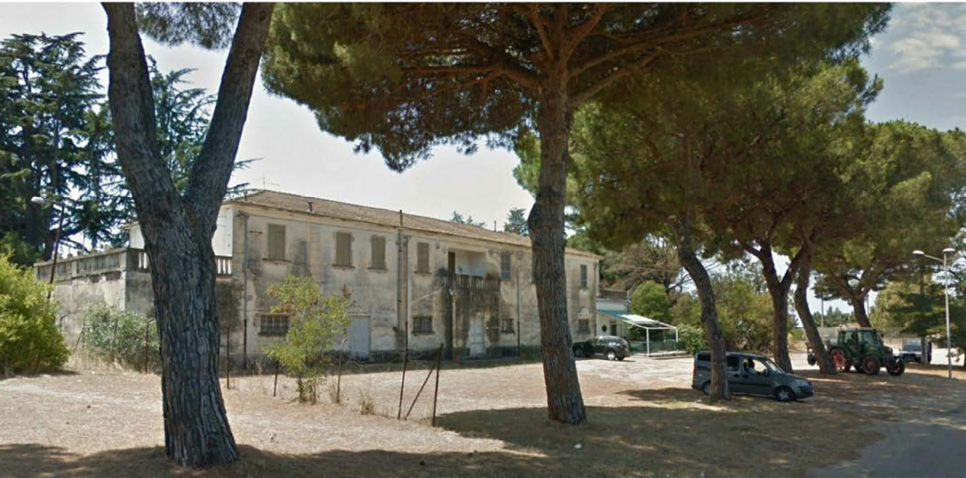
Prospetto principale Fabbricato A Ambito Gromola