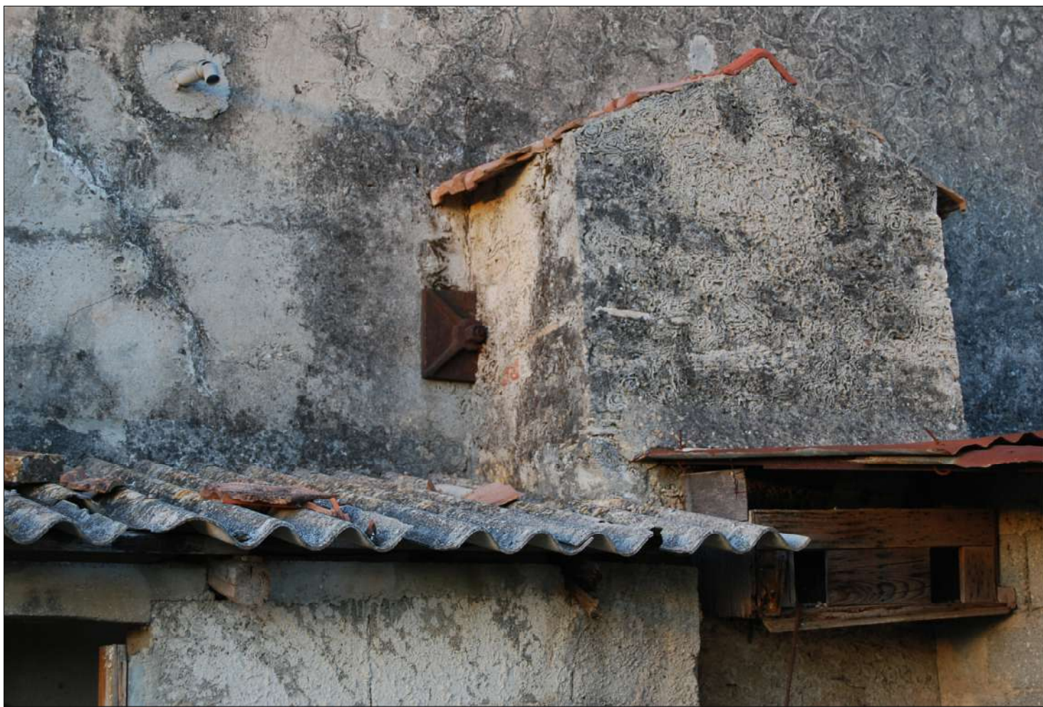
FOTO 7 prospetto sud dettaglio