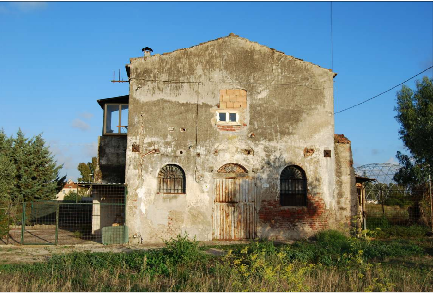
FOTO 3 prospetto ovest