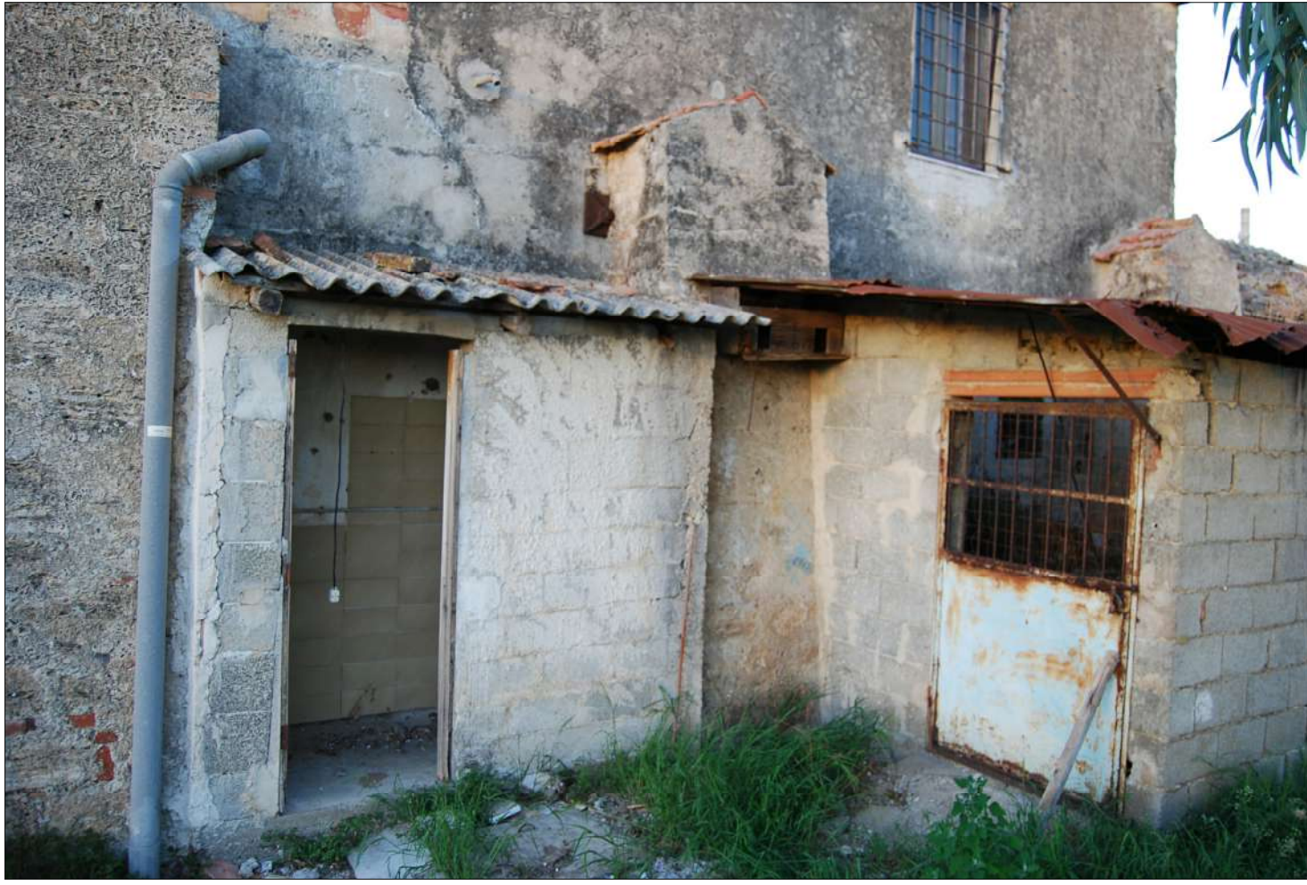
FOTO 9 prospetto sud ovest corpi aggiunti da rimuovere