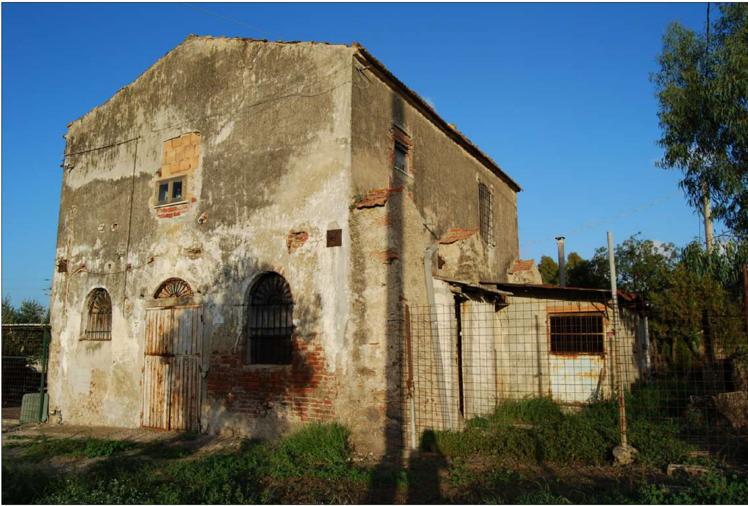
FOTO 4 prospetto ovest