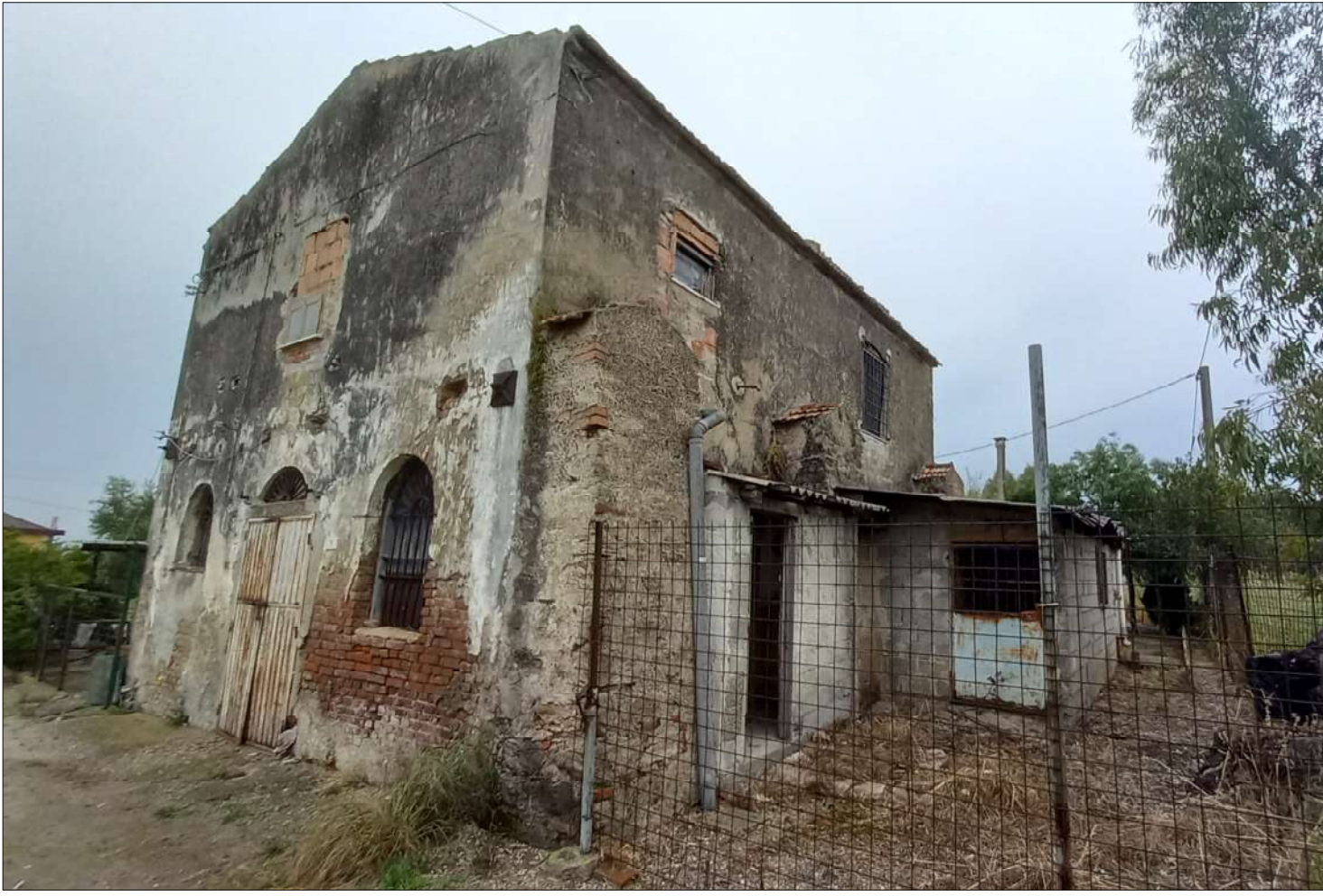
FOTO 6 prospetto sud ovest corpi aggiunti da rimuovere