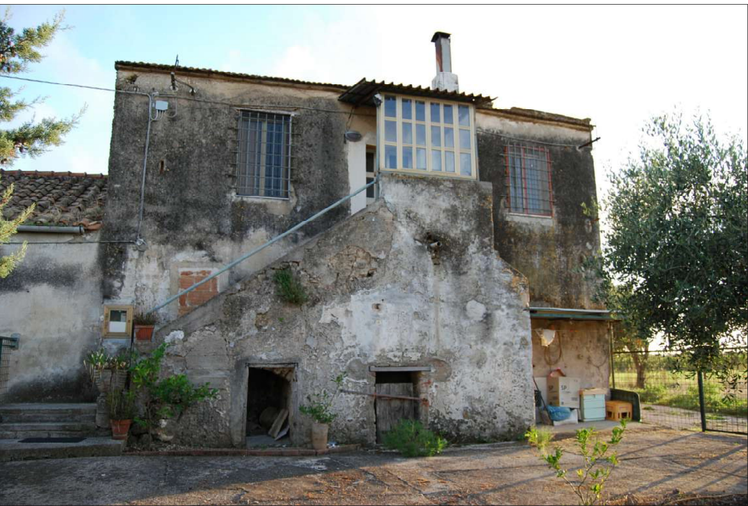
FOTO 1 prospetto nord