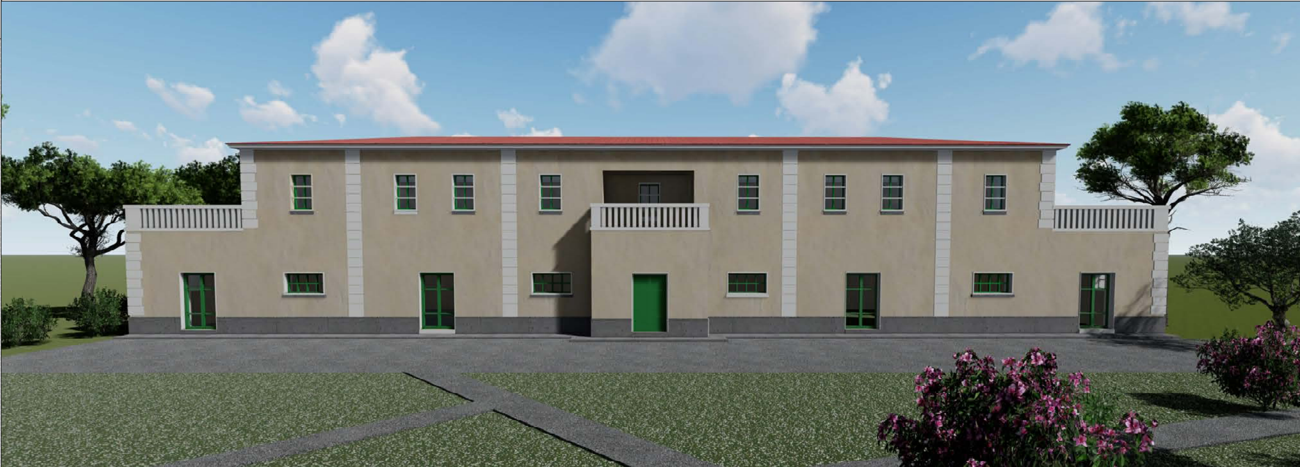
Ambito 2 - Fabbricato A